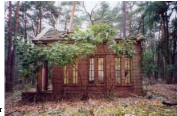
Mausoleum auf dem Südwest - Friedhof Stahnsdorf