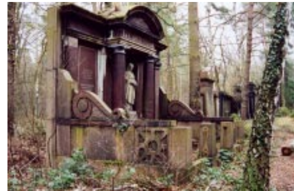
Südwest - Friedhof Stahnsdorf, Teil der Umbettungsreihe aus dem Alten St.Matthäus - Friedhof in Schöneberg