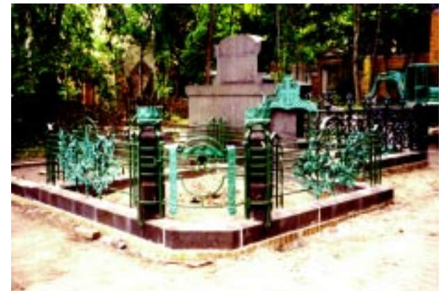
Friedhof II der Ev. Georgen- Parochialgemeinde Gittergrab nach der Sicherungsmaßnahme