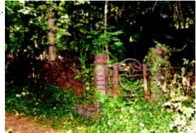
Friedhof II der Ev. Georgen- Parochialgemeinde Gittergrab im vorgefundenen Zustand

Den Bauarbeiten gingen umfangreiche historische Recherchen zu Gräbern und Gesamtanlagen voraus, ebenso wurden gründliche Untersuchungen des Erhaltungszustandes der Bausubstanz durchgeführt. Bei Bedarf mußten weitergehende Untersuchungen des Farbschichtenaufbaus, der Putzzusammensetzung, kunsthistorische Gutachten oder Ultraschalluntersuchungen durch jeweilige Fachgutachter durchgeführt werden.