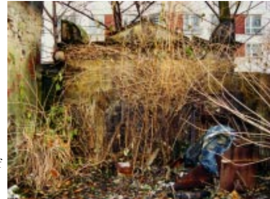
Alter Friedhof der Marien - Nikolai - Gemeinde, Wandgrab Richter vorgefundener Zustand

Das Programm konnte größtenteils gemäß entsprechender Planung durchgeführt werden. In Einzelfällen ergaben sich inhaltliche Änderungen durch zwischenzeitlich fortgeschrittenen Verfall oder durch äußerlich zu Beginn nicht vollständig erkennbaren Schadensumfang. Kleinere Zusatzarbeiten vervollständigten in seltenen Fällen die Maßnahmen zu einem optisch befriedigenden Gesamteindruck.