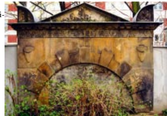
Alter Friedhof der Marien - Nikolai - Gemeinde Wandgrab Richter nach der Sicherungsmaßnahme